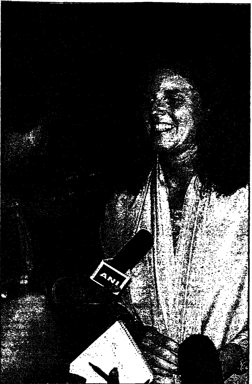
سارة فيرغسون دوقة بورك وست في بلدة بنجالور في جنوب الهند امس الاول لتفتتح لعلاج روحياني تقوم به عرافة هندية بالبلدية

على صعيد العمل بتوقع التغير ان اكبر نمو في هذا المجال سيكون في قطاع الخدمات الشخصية والخدمات مثل الصلاة ومرتبات الأطفال والتبريد والسخانات الكهربائية والعاملين في مجال المكاتب والأجهزة وسيدخل هذا القطاع وحده في اواسط العقد القادم بزيادة بمقدار نصف مليون عامل وعاملات.